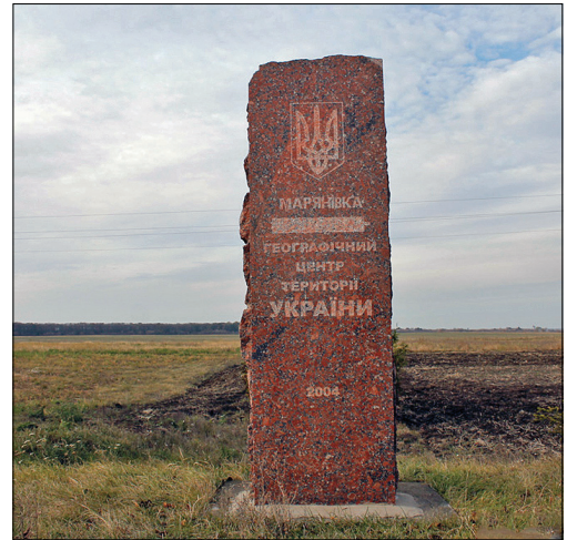
Географічний центр України — на околиці с. Мар'янівки (Черкаська область)

Найбільша за площею країна, що повністю лежить у Європі. Простягається з півночі на південь на 893 км, із заходу на схід — на 1 316 км. Територія: загальна — 603,5 тис. км², суходіл — 579,3 тис. км², вода — 24,2 тис. км². Станом на 2021 рік близько 7 % території тимчасово окуповано. Довжина морського узбережжя — 2 759,2 км. Крайні точки: на півночі — с. Грем'яч (Чернігівська область), на півдні — мис Сарич (Автономна Республіка Крим), на заході — околиця м. Чопа (Закарпатська область), на сході — с. Рання Зоря (Луганська область). Географічний центр України — на околиці с. Мар'янівки (Черкаська область). В Україні розташований гіпоте-